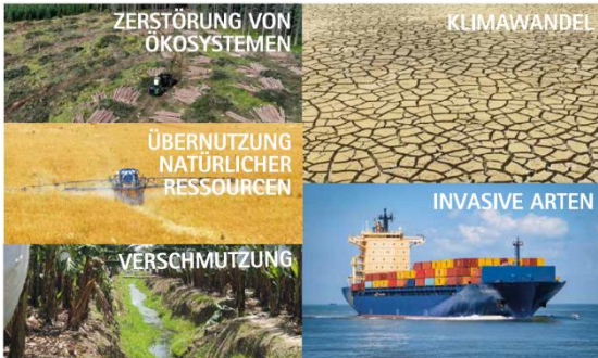
Die Ursachen bzw. "Treiber" für den Verlust der Biodiversität